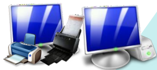
Резервные станции КЕГЭ