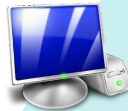
Резервная станция КЕГЭ

В случае выхода из строя основной станции КЕГЭ и продолжения выполнения экзаменационной работы участником КЕГЭ на резервной станции необходимо НАПРАВИТЬ в ОРЦОКО ( 57_monitoring@orcoko.ru ) служебную записку .