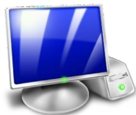
Основная станция КЕГЭ